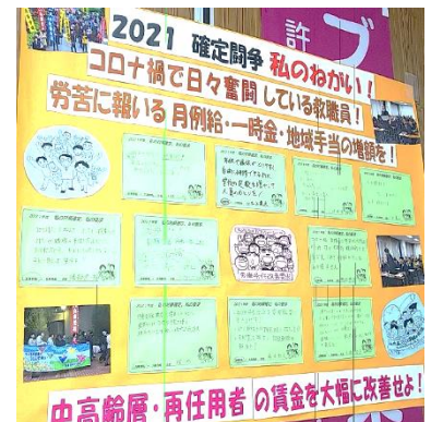
タペストリー 私の願い

交渉の経過は「調査情報」でお知らせします。みんなの願いをこめて、署名にもご協力ください。