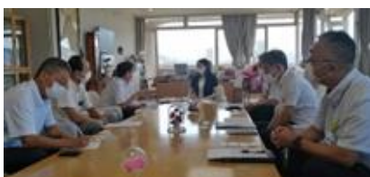
宝塚市でのキャラバン 市長も同席

香美町では、小中学校の統廃合の問題が現実味を帯びてきました。保護者の中にはより規模の大きな学校との統合を早くしてほしいという声もあるようです。地域の拠点ともいえる小中学校をなくすことで、地域社会がどのような影響をうけるのか、慎重に考えていく必要があると思います。労働や福祉の問題など、学校存続をめぐる、地域の様々な問題をどう認識し、どのように解決に向かうのか、私たちの行動が試されるのだと思いました。