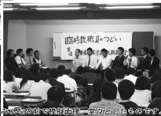
みんなの前で模擬面接。堂々としたものです。