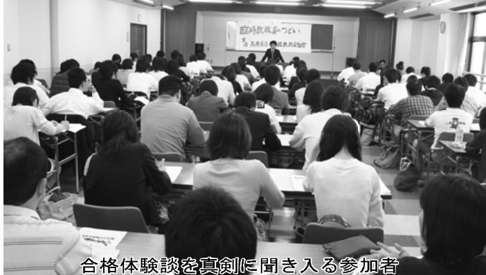
合格体験談を真剣に聞き入る参加者