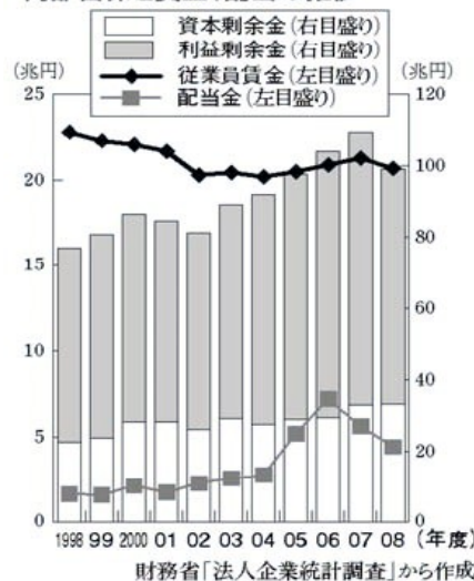
製造業大企業(資本金10億円以上)の内部留保と賃金、配当の推移

県内の中小業者は、不況の影響をまともに受けており、高校生を雇いたくとも雇えません。県は、パナソニックに 210 億円などの多額の補助金をやめて、雇用を促進した中小業者にこそ補助金を使うべきです。