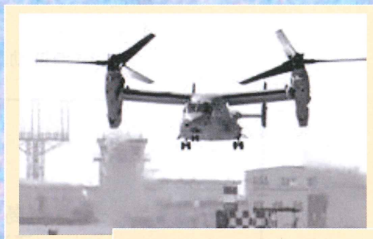
岩国基地を飛び立つオスプレイ