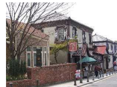
戦時中は抑留所にされた異人館